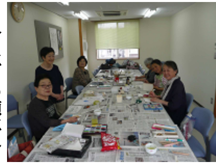
差入のお菓子で一休み。左下のお二人が筆入れ話に花が咲いていました。

絵手紙教室を開催しました。今回は、おうちの事情で、なかなか参加出来なかった方も参加されて、にぎやかな絵手紙の時間となりました。ラップの芯で筆入れを作られていた方がいらっしやうと、孫に作ってあげたいので見せてと、普段接触の無い方同士の交流もあり、有意義な時間となりました。5月絵手紙の作品は民商北側展示コーナーに展示しています。是非、ご覧下さい。