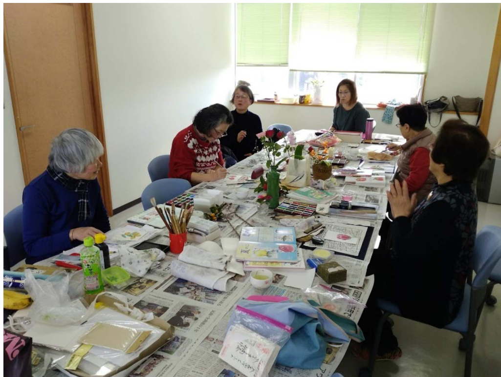
今回は婦人部総会で飾ったバラやスイートピーの花やバナナなどの果物、ひよっこやおかめなどを描きました。

4月19日開催予定の「有馬温泉バスツアー」についても、ゆっくりしたい、との声をとり入れて、温泉での滞在時間を長くしよう」帰りには「道の駅」などに寄れたらいいね」などと話し合いました。