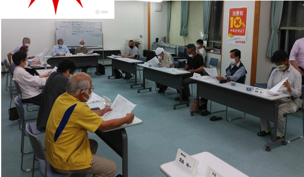
換気やソーシャル・ディスタンスに留意して2ヶ月ぶりに理事会を開催しました。

発行 奈良民主商工会 奈良市大森西町13-16 電話0742-33-7266 FAX 0742-34-5826 HP naramsyo.jp