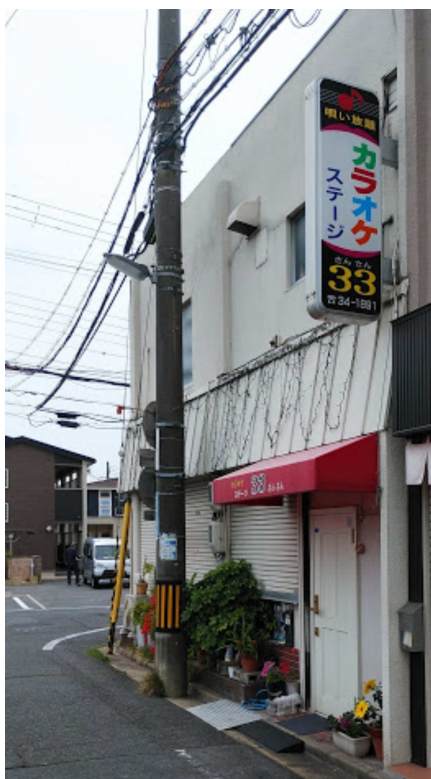
『カラオケステージ33』 奈良市四条大路上1-3-12 ☎0742-34-1891