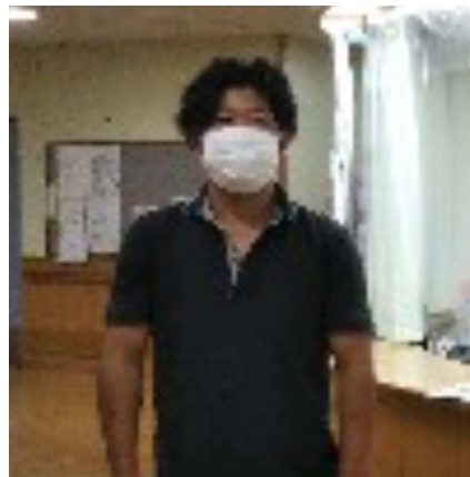
サポートした西濱共済会副会長

10月15日、奈良民商共済会は吉田病院で集団健診を開催し、都跡支部、伏見南・北支部、学園前支部から会員・家族・従業員ら33人が参加しました。 今年は、新型コロナウイルスの感染防止に心がけ、受付前に手指消毒、検温を行いました。 参加者は午後4時半頃から集