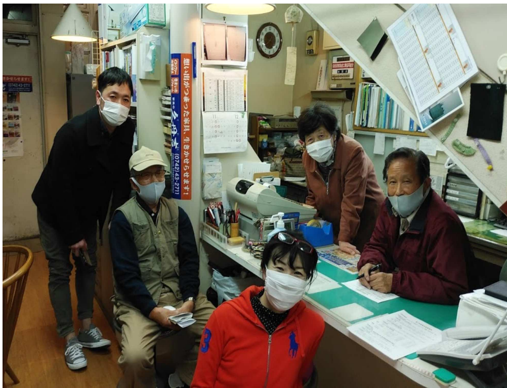
ソーシャルディスタンスの席を移動して写真撮影

コロナ禍で中小業者の苦境が続く中、給付金が底をついた。GOTOよりも直接支援を」などの声が上がっています。一方、政府は給付金を打ち切る方向を打ち出しています。支援の継続・拡充させるため、商工新聞読者、会員の仲間を増やして15日の全商連総会を前進で迎えましょう。