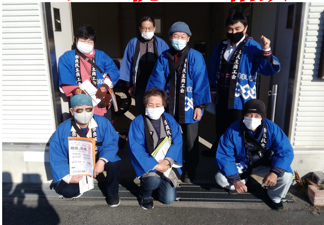
朝は厳しい冷え込みでしたが、晴天に恵まれ、感染予防にも留意して元気に行動しました。

1月10日、奈良民商は宣伝・対話統一行動にとりくみ、出足早く2021年「春の運動」をスタートさせました。役員・事務局8人が参加。チラシ1000枚を配布し、街の中小業者に「いよいよ確定申告が始まります」コロナと税金の相談は民商へ」の声を掛けました。