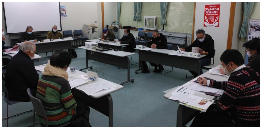
行動前に地図を見て準備する参加者

今後の活動については、『春の運動』で、宣伝カーの運行やチラシの配布などの宣伝行動にとりくみ、各支部、商工新聞読者5人、会員3人の仲間を増やすこと、3・13重税反対全国統一行動、奈良集会を3月12日に開催することなどを確認しました。