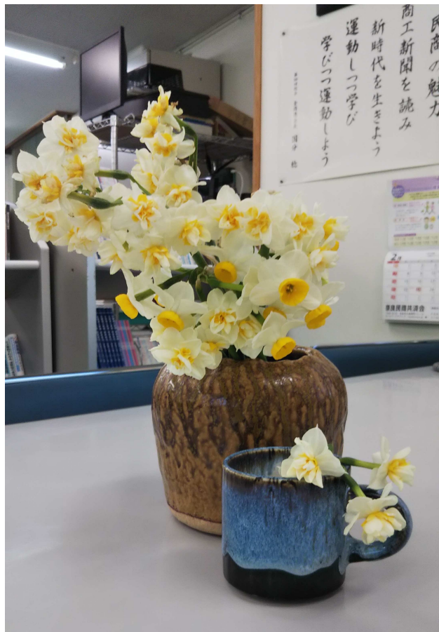
水仙が春の訪れを感じさせます。

い花とされ、香りがよいことから香水の材料にもされてきました。事務所いっぱい水仙の香りが心を和ませてくれます。