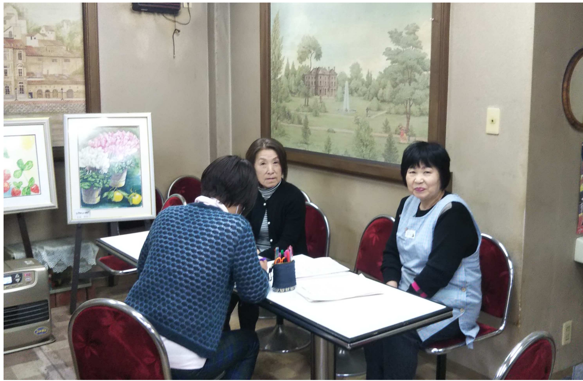
絵画教室に通うお客さんの絵が季節ごとにお店に飾られます。