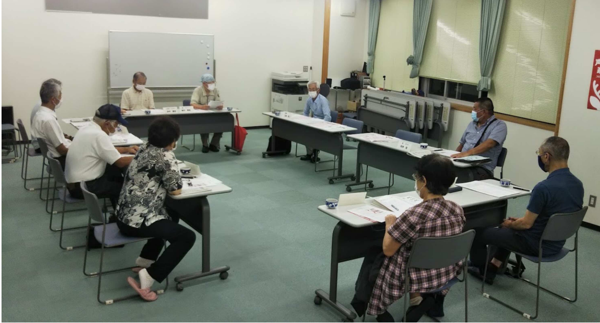
感染対策にも気を付けて短時間で開催しています。

奈良民商は9月1日、理事会を開催しました。この間のコロナ対策での奮闘を交流し合い、『秋の運動』と総選挙でがんばる決意を固めました。