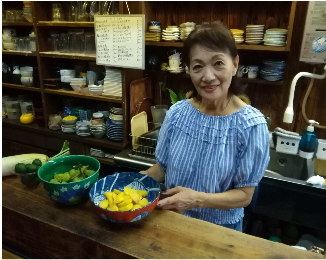
カウンターには茄子の煮びたし、きゅうりの酢の物などの大皿料理が並びます。