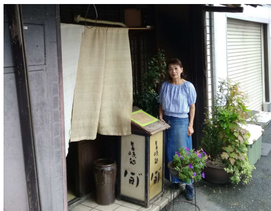
お店は三条通に面しています。